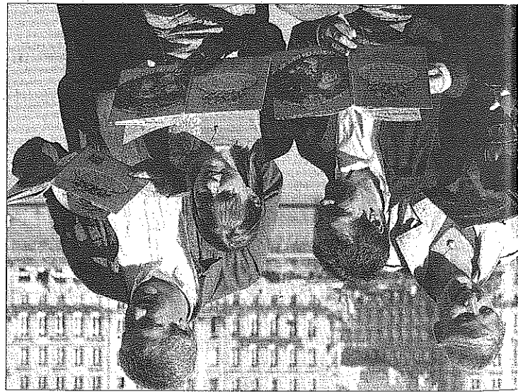
stères de l'espace n'auront plus de secrets.

volume du « Monde merveilleux demain. Après les dinosaures, l'espace